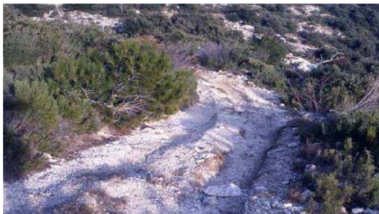
Traces de quad dans le massif de Sainte-Baume, Provence

Service communication 01 44 08 02 52 / presse@fne.asso.fr