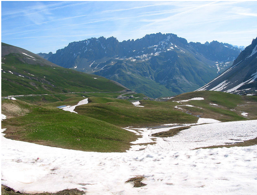
Le col du Galibier – Plan Lachat

Avec 17 000 lits-skieurs, Valloire est la plus importante station de ski de la vallée de la Maurienne. La station de ski offre plus de 100 km de pistes. La station de ski de Valloire n'a pas la renommée des grandes stations de Tarentaise : Val d'Isère, Tignes, Les Arcs, La Plagne, les 3 Vallées Courchevel-Méribel-Les Ménuires. Mais les atteintes à l'environnement apportées par les pistes de ski de Valloire existent : paysage altéré avec coupure dans les boisements, dérangement de la faune (tétras lyre notamment), zone humide naturelle remplacée par une retenue collinaire de 240 000 m 3 etc... Un festival de sculptures sur glace attire, chaque hiver, des visiteurs.