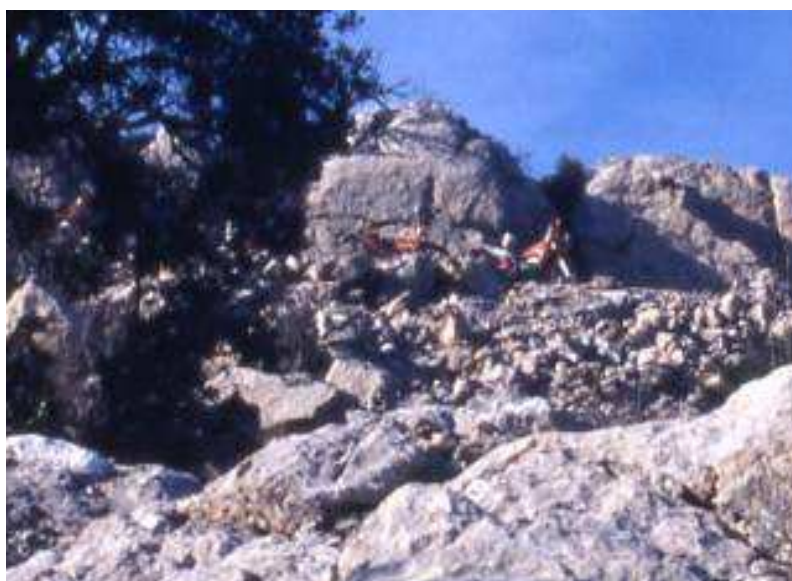
Motos sur la piste DFCI, près du col de Bertagne