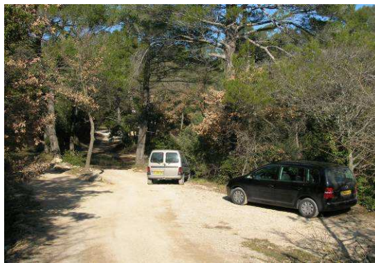
Véhicules stationnés sur la piste DFCI U452 du Latay, près du gué.