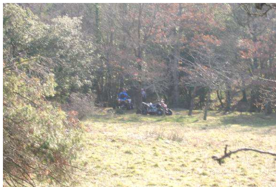
Quads ayant traversé le Latay, près de la ferme du Latay