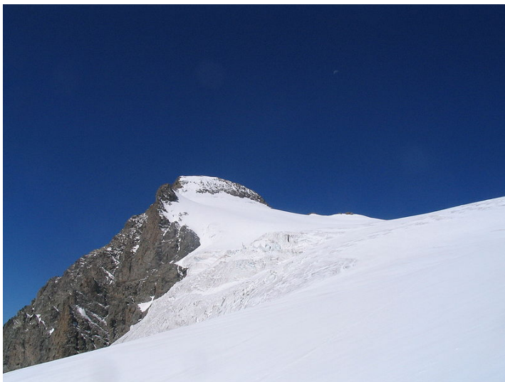
Les Rouies, Parc Naturel des Ecrins