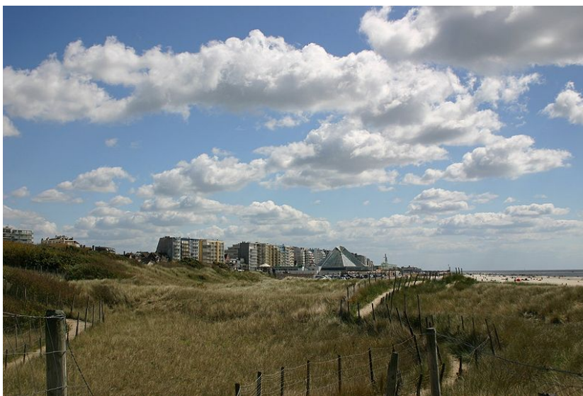
Les dunes du Touquet

Chaque année, à la mi-février, cette course réunit plus de 1200 pilotes en 2 ou 4 roues. La Cour administrative d'appel de Douai a estimé en 2005 que compte tenu des données scientifiques disponibles relatives au caractère remarquable et vulnérable des lieux, le préfet du Pas-de-Calais avait fait une insuffisante appréciation des intérêts écologiques à protéger en autorisant l'épreuve. (CAA Douai, 18 janvier 2005, Association le MOTO-CLUB DES SABLES, n° 03DA00361)