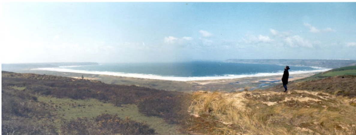
L'anse de Vauville, montage panoramique.

,Au-delà de la simple reconnaissance de la contravention, le tribunal correctionnel de Cherbourg, en février 2009, a reconnu la culpabilité des prévenus pour les délits prévus au code de l'environnement, le site dunaire abritant également une espèce végétale protégée. Le tribunal de Police de Caen a condamné certains motards à des peines d'amende, à verser des dommages et intérêts aux associations et à publier des extraits de la décision dans la presse.