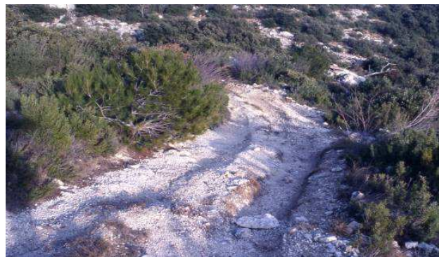
Pistes sauvages près du lieu-dit « les Boulders »