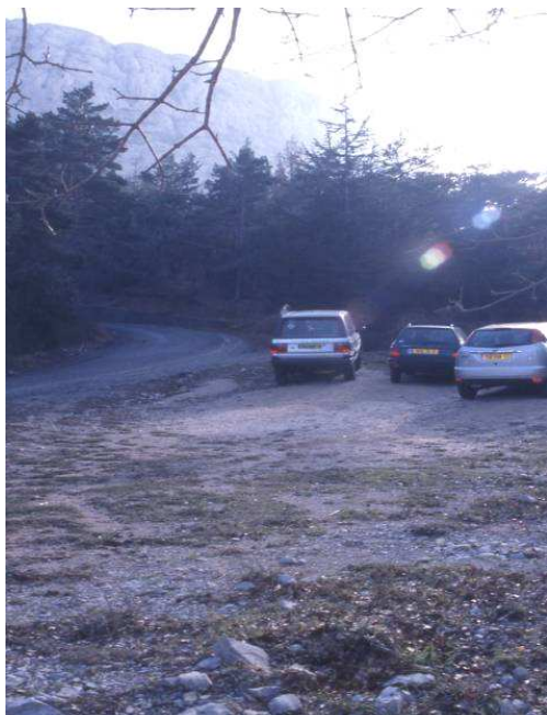
Véhicules stationnés au Col de Bertagne

A noter que le même jour des quads ont été observés dans le secteur de la Taurelle.